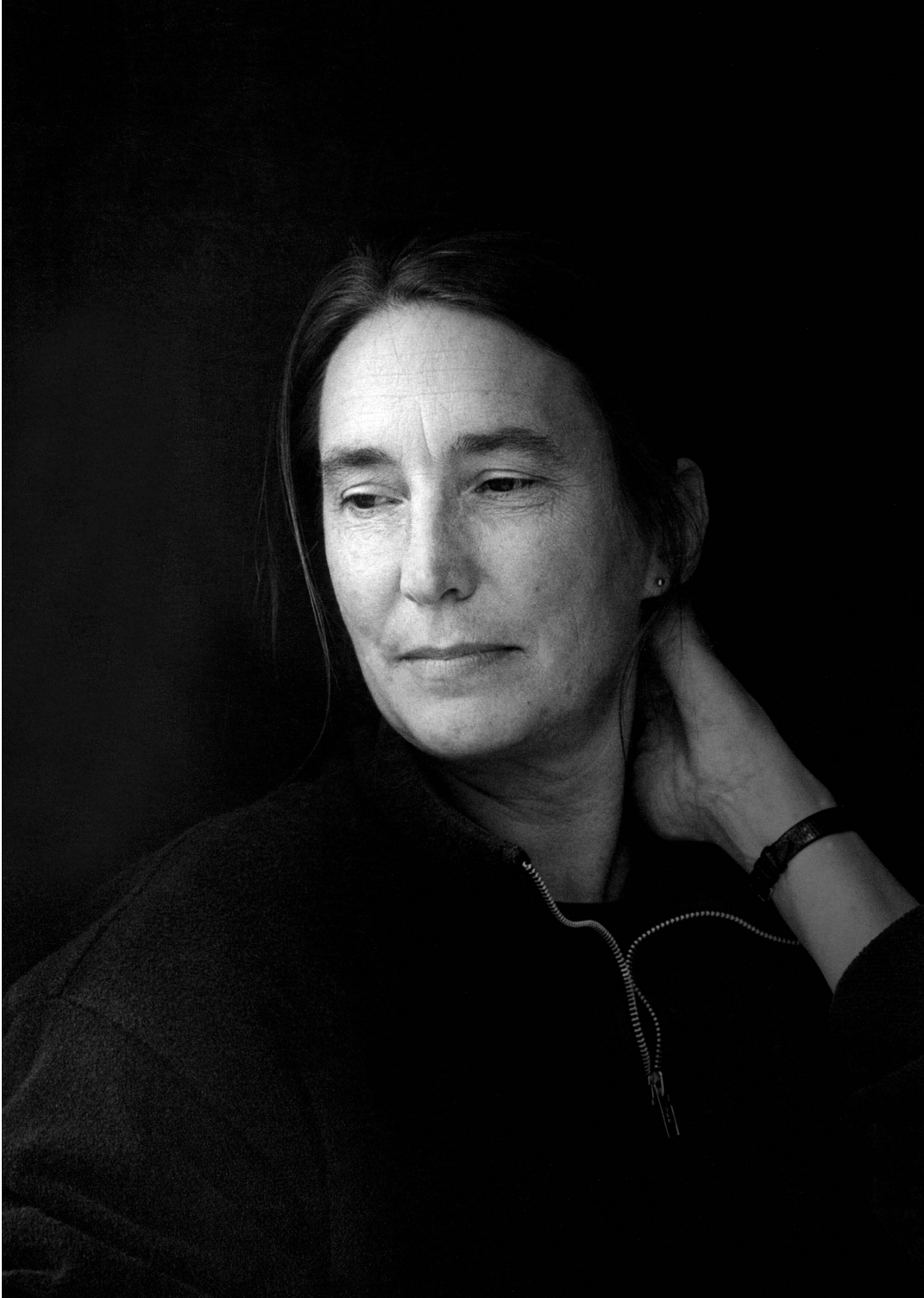
Jenny Holzer. Photo : Nanda Lanfranco © Jenny Holzer. ARS, NY and DACS, London 2019